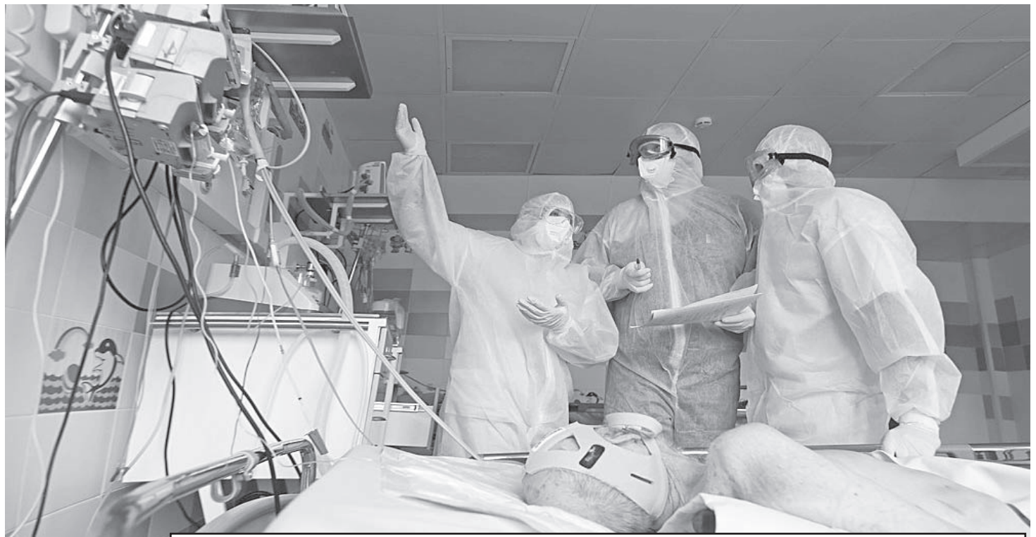
Врачи, работающие в красной зоне, уже полтора года проводят в защитных костюмах по восемь часов в день.

Ситуация ухудшается с каждым днем, даже несмотря на то, что Ивановская область входит в число регионов-лидеров по строгости ограничительных мер. Исследование провел фонд "Центр политической конъюнктуры". "В регионе расширили спи-