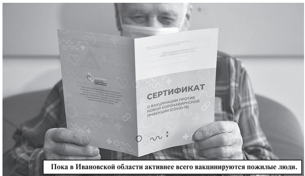
Пока в Ивановской области активнее всего вакцинируются пожилые люди.

Власти Ивановской области 7 октября ввели обязательную вакцинацию для ряда сфер: предприятия торговли, общепита, бытовых услуг, транспорта, гостиницы, фитнес-клубы, МФЦ и ряд других - должны будут провакцинировать от коронавируса 80% коллектива. Постановление подписал главный санитарный врач региона Павел Колесник. Первую прививку ивановцы, работающие в этих сферах, должны сделать до 20 октября, вторую - до 20 ноября. Как показывает практика других регионов, такие меры помогают сдвинуть вакцинацию с мертвой точки.