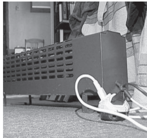
навливать их в захламлённых и замусоренных помещениях.

Нельзя также использовать обогреватели в помещениях с лакокрасочными материалами, растворителями и другими воспламеняющимися жидкостями, уста-