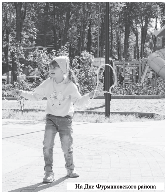
На Дне Фурмановского района