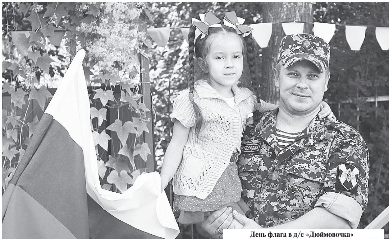
День флага в д/с «Дюймовочка»