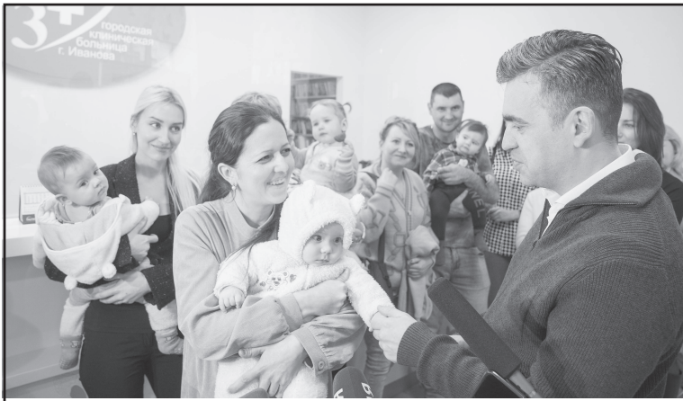
В рамках проекта «Решаем вместе» в области ремонтируют детские поликлиники

По разным программам за пять лет подрядчики благоустроили 533 территории, из них 46 – популярные места отдыха жителей. Кохма, Юрьево, Плёс, Южа, Тейково, Шуя, Кинешма, Вичуга, Фурманов, Гаврилов Посад... выиграли гранты на благоустройство во всероссийском конкурсе Минстроя.