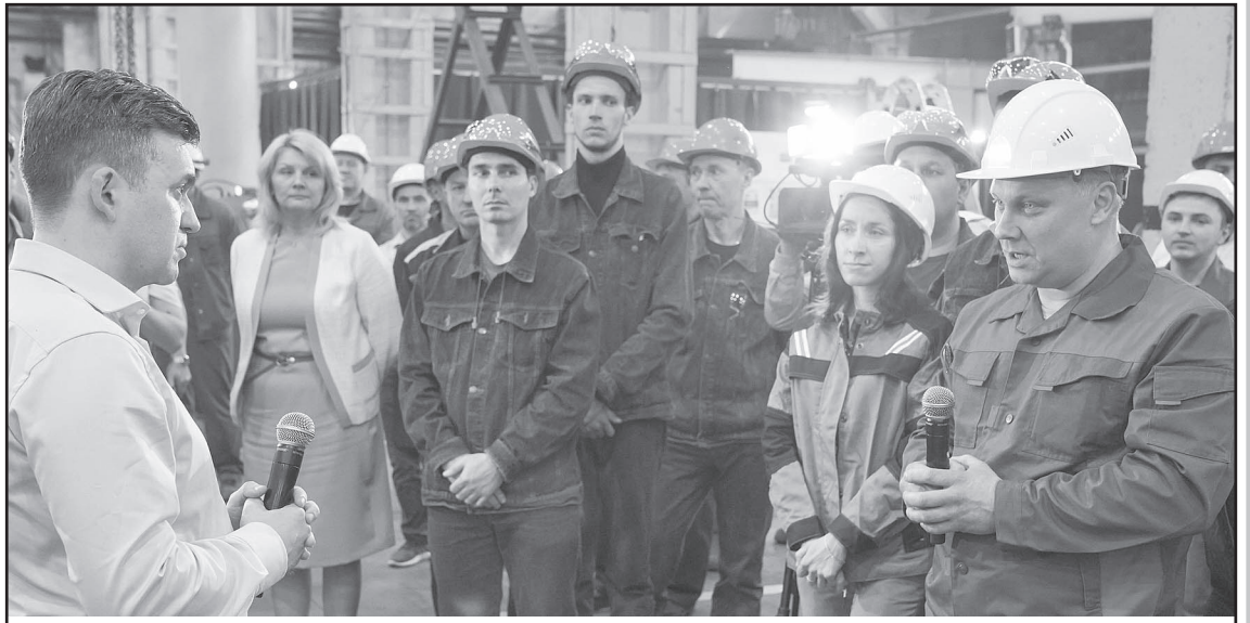
«Мне очень важно мнение людей, важна ваша поддержка»

По словам начальника цеха, на завод «Профессионал» при-