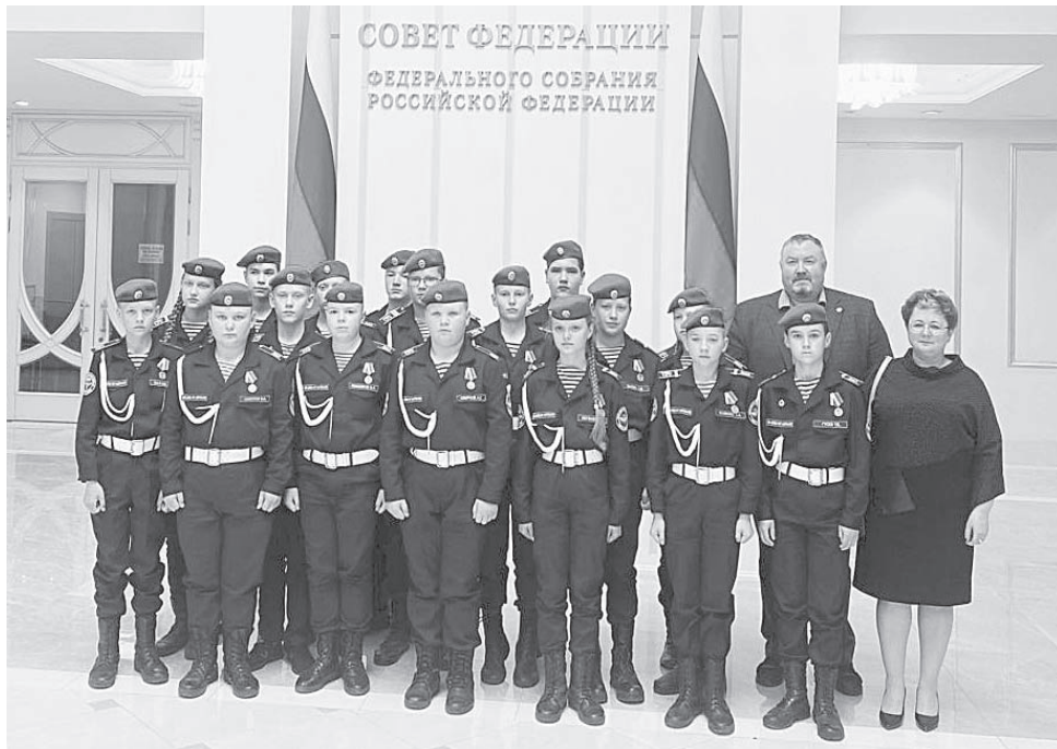
Экскурсия в СФ вызвала у ребят много положительных эмоций, способ-

Регулярно в СФ проходят Дни субъекта Российской Федерации. 23-24 мая здесь проходили Дни Тюменской области. Ребята имели возможность посетить интерактивную выставку-презентацию, в ходе которой узнали интересные факты о развитии Тюмени, о её особенностях и достопримечательностях.