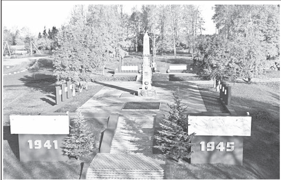
Мемориальный комплекс в д. Микулино Руднянского района Смоленской области.